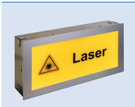
Unterputzgehäuse mit Aluminium Blendrahmen