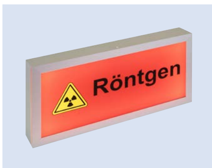
Aufputzgehäuse aus Aluminium